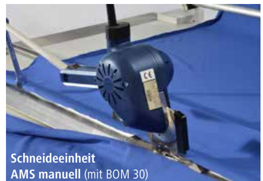
Schneideeinheit AMS manuell (mit BOM 30)

Das umfassende Produktprogramm ermöglicht Lösungen auch für Ihren Bedarf. In unserem Vorführzentrum stehen Lege- und Zuschneidemaschinen zur allgemeinen Demonstration sowie auch für Testschnitte mit Ihren eigenen Materialien bereit.