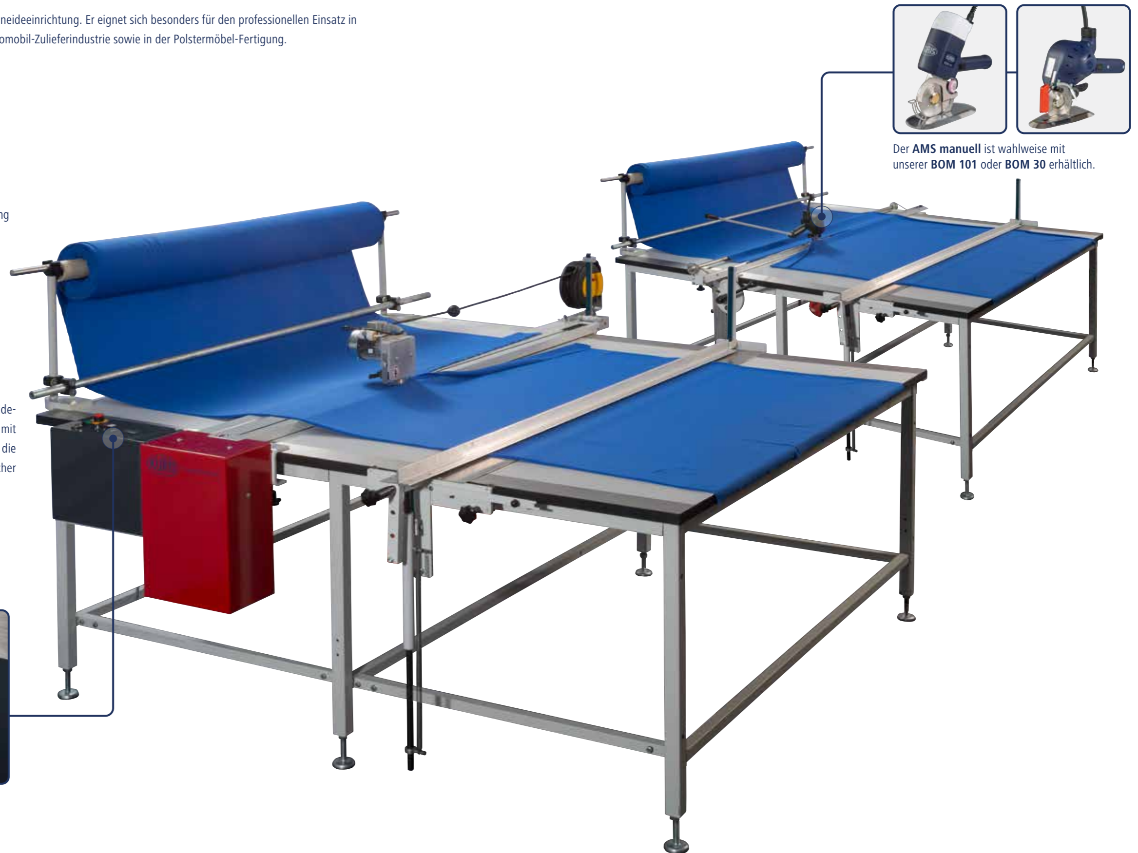
Der AMS manuell ist wahlweise mit unserer BOM 101 oder BOM 30 erhältlich.

Die manuelle Ausführung des Crosscutters hat eine Abschneidevorrichtung mit Vertikalanhebung und eine Stoffhalteschiene mit Schnellverstellung. Als Abschneidevorrichtung ist wahlweise die „BOM 30 S“ oder die „BOM 101 S“ vorgesehen. Ein mechanischer Längenzähler kann optional dazu gewählt werden.